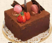
23 ショコラde ショコラ

抹茶のスポンジ、抹茶のクリームで、あずき・栗をサンド。 4号 2,484円・5号 3,348円・6号 4,104円 7号 5,400円・8号 7,020円