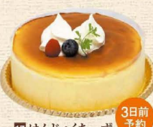
17 はんじゅくちーズ

新鮮な卵をたっぷり使いふわふわのスポンジにフレッシュイチゴをサンド。 4号 2,484円・5号 3,348円・6号 4,104円