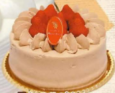
2 シャンティオショコラ

新鮮な卵をたっぷり使いふわふわなスポンジにフレッシュイチゴをサンド。みんな大好きなイチゴのデコレーションです。 4号 2,268円・5号 3,132円 6号 3,888円・7号 5,184円 8号 6,804円