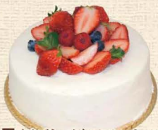
3 イチゴたっぷりデコレーション

じっくりと焼き上げたココアのスポンジにチョコレートクリームを薄くサンドしました。 4号 2,376円・5号 3,240円・6号 3,996円 7号 5,292円・8号 6,912円