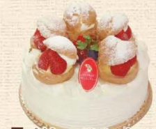
6 プチシューデコレーション

追熟させたフルーツをたっぷり飾ったデコレーションです。 4号 2,808円・5号 3,672円・6号 4,428円 7号 5,724円・8号 7,344円