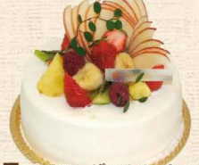
5 フルーツいっぱいデコレーション

新鮮な卵をたっぷり使いふわふわなスポンジにフレッシュイチゴをサンド。季節のフルーツを色どりに飾りました。 4号 2,268円・5号 3,132円・6号 3,888円 7号 5,184円・8号 6,804円