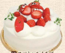
16 スペシャルイチゴ

新鮮な卵を使い、ふわふわなスポンジにフレッシュイチゴをサンド。好む方のイチゴクリーム 4号 2,700円・5号 3,456円・6号 4,212円 7号 5,616円・8号 7,236円