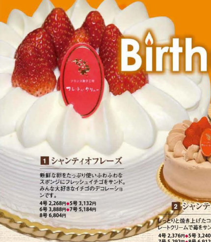
1 シャンティオフレーズ

新鮮な卵をたっぷり使いふわふわなスポンジにフレッシュイチゴをサンド。みんな大好きなイチゴのデコレーションです。 4号 2,268円・5号 3,132円 6号 3,888円・7号 5,184円 8号 6,804円