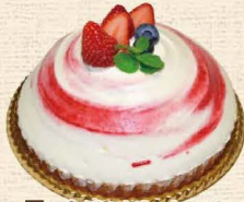
8 いちごのクリームタルト

じっくりとオープンで焼き上げたバイクチーズに季節のフルーツをあしらいました。 5号 3,348円