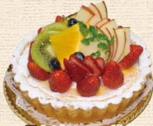
7 タルトフロマージュ

新鮮な卵をたっぷり使いふわふわのスポンジにフレッシュイチゴをたっぷりサンド。シュークリームをかわいらしく飾りました。 5号 3,348円・6号 4,212円・7号 5,400円 8号 7,020円