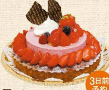
9 いちごのムースタルト

上質なバターを使ったタルトに、たっぷりのクリームをのせてデコレーションしました。 4号 2,916円・5号 3,672円・6号 4,536円