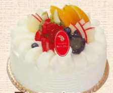
4 シャンティオフルーツ

当店自慢のイチゴのデコレーションにたっぷりのイチゴを飾ったイチゴづくしのデコレーションです。 4号 2,808円・5号 3,672円・6号 4,428円 7号 5,724円・8号 7,344円