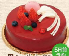
13 ルージュショコラ

サクサクパールの上にチョコレートムース、コーヒークリームを仕込み、キャラメルでコーティングしました。 4号 2,160円・5号 3,024円・6号 3,564円