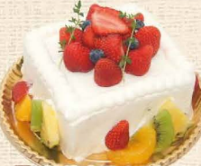
25 プレゼントデコレーション

しっとり焼き上げたココアのスポンジにちょっとピターなチョコレートクリーム。口どけ滑らかなチョコレートガナッシュでコーティングしました。 4号 1,944円・5号 3,024円・6号 3,888円 7号 5,184円・8号 6,804円