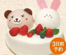
29 くまとうさぎのデコレーション

イチゴのデコレーションケーキにイチゴのチョコをたっぷりかけて、さらにイチゴを飾りました。 5号 3,456円